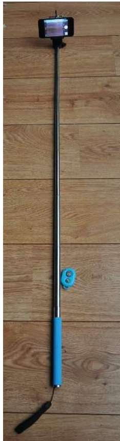
Figura 7: Palo para selfie