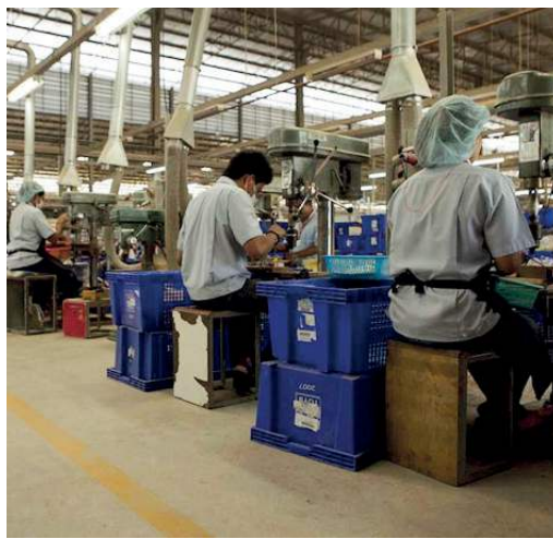
Figura 5: Producción manual de la casa de muñecas de Plan Toys

En la Figura 6 se muestra una casa de muñecas verde amueblada y terminada. La empresa goza de reconocimiento mundial por su fabricación sustentable y sus buenas prácticas.