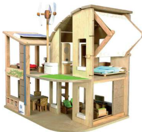
Figura 6: Casa de muñecas amueblada verde